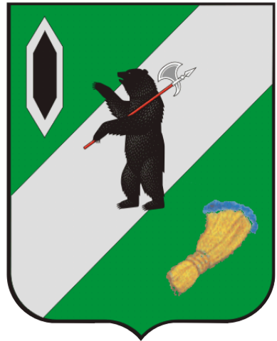
СХЕМА ТЕРРИТОРИАЛЬНОГО ПЛАНИРОВАНИЯ ГАВРИЛОВ-ЯМСКОГО МУНИЦИПАЛЬНОГО РАЙОНА ЯРОСЛАВСКОЙ ОБЛАСТИ